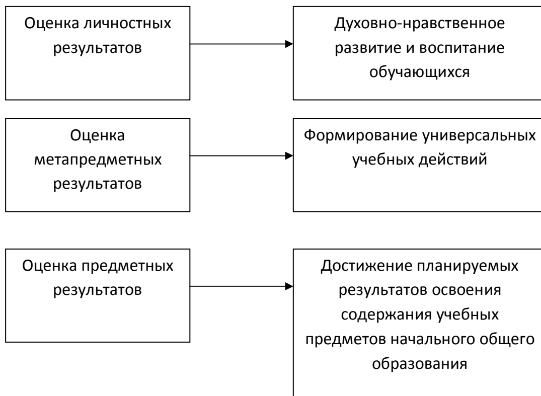
Рис. 1. Влияние системы оценки на образовательную деятельность

Система оценки как комплекс оценочных процедур мотивирует учащихся на достижение планируемых результатов различных групп, но важным условием повышения уровня мотивации к образованию в течение всей жизни, освоению умения учиться является реализация программы формирования универсальных учебных действий, включающей типовую задачу «Технология безотметочного оценивания». Применение данной технологии позволяет сократить количество оценочных процедур, проводимых учителем на уроках, переориентировать систему оценки с «накопления отметок» на фиксацию достигнутых учащимися планируемых результатов, а также обеспечить формирование у учащихся универсальных учебных действий – контроля, оценки, познавательной рефлексии и смыслообразования.